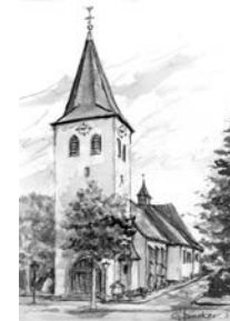
St. Joseph Ostwig