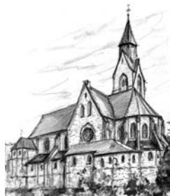
St. Anna Nuttlar